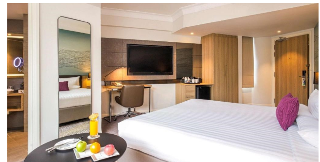
Eksempel på værelse