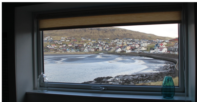
Udsigt fra værelse

Et utroligt hyggeligt sted med atmosfære.