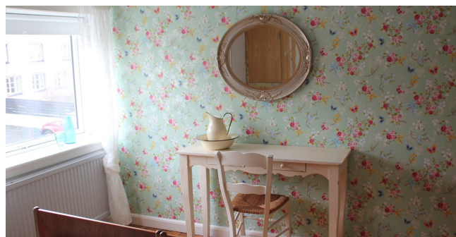
Eksempel på værelse