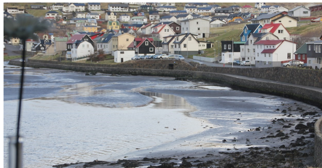
Udsigt fra værelse