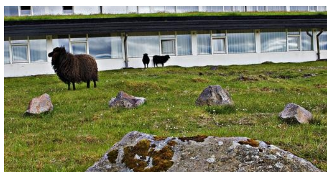
Får foran hotellet