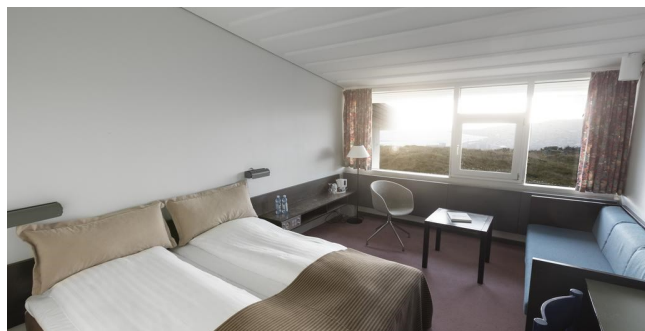
Eksempel på værelse