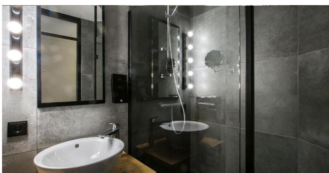
Eksempel på bad