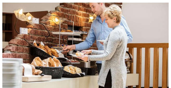
Eksempel på morgenmaden