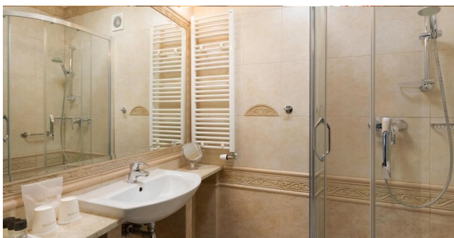
Eksempel på bad