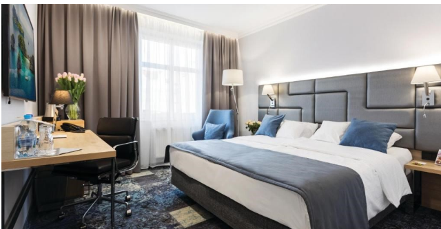
Eksempel på værelse