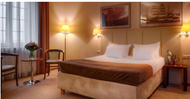
Eksempel på værelse