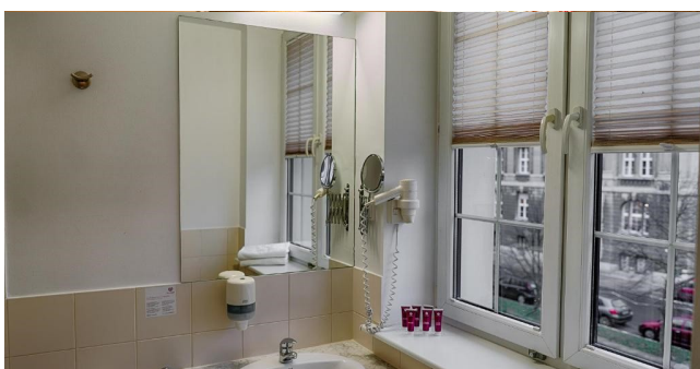
Eksempel på bad