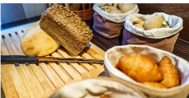
Eksempel på morgenmad