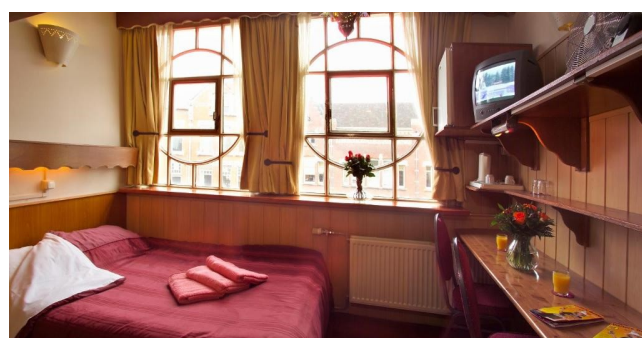
Eksempel på værelse