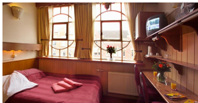
Eksempel på værelse