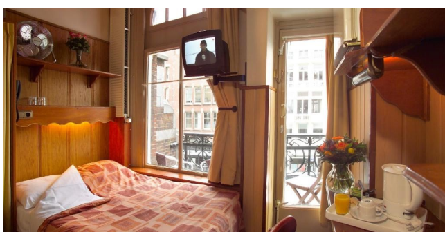
Eksempel på bad