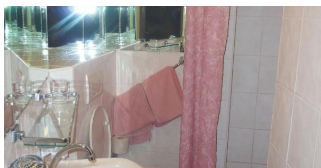
Eksempel på værelse