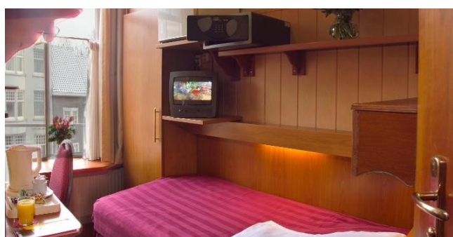
Eksempel på værelse