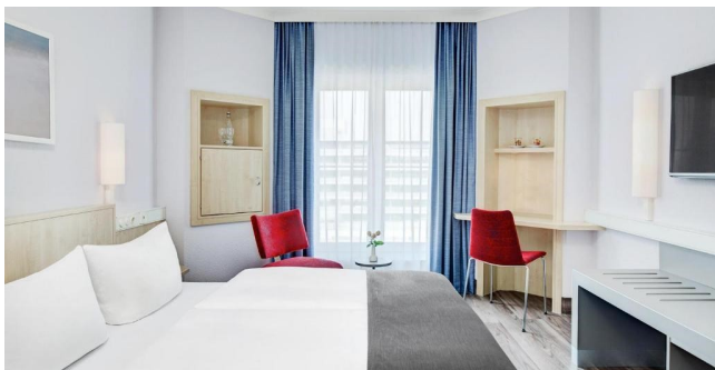
Eksempel på værelse