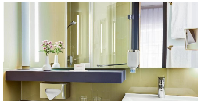
Eksempel på bad