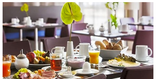
Noget af morgenmadsbufeen