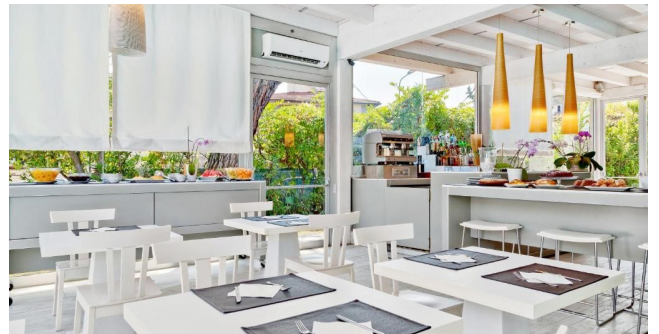
Eksempel på morgenmad