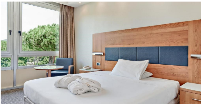
Eksempel på værelse