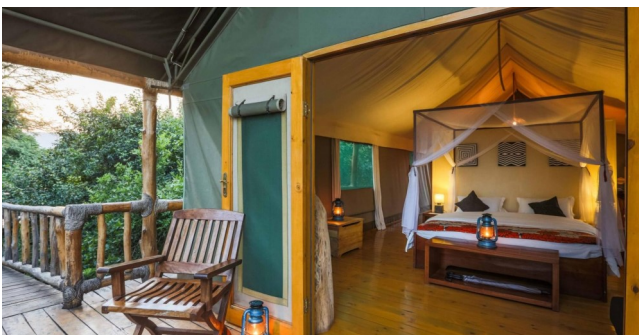
Eksempel på hytte