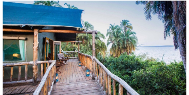
Telt med udeareal