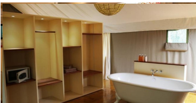
Eksempel på badeværelse