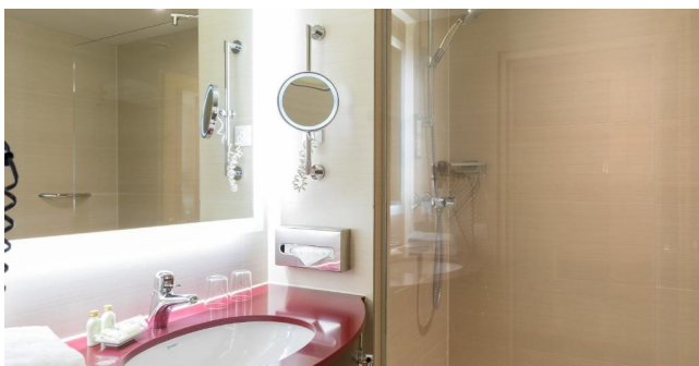
Eksempel på bad