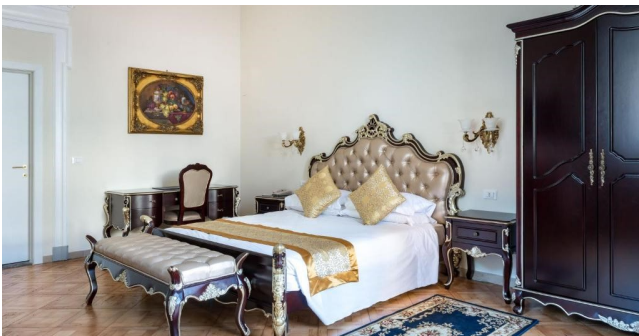
Eksempel på værelse